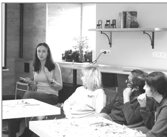
Робоча зустріч з клієнтами центру

мільйони можуть одночасно з'єднатись між собою через електронну пошту та додати свої імена до електронної петиції за лічені секунди. І, звісно, соціальні мережі, такі як Instagram, Facebook, Messenger, Viber, Telegram, WhatsApp – на мій погляд є «рушійною силою демократичних повстань».