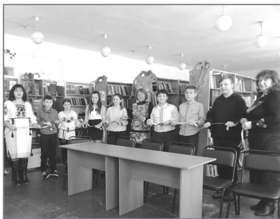
Проведення заходу в бібліотеці (до початку карантину)

залюбки брала активну участь. Це були віртуальні виставки, участь у челенджах* між бібліотеками районного рівня (по Кобзареві, Ліна Костенко, з екологічної тематики). Дуже цікава була така робота, тому що кожна людина виставляє свою інформацію, вона її готує, подає так, як вона це бачить. І під час підготовки різних челенджів, ми з колегами використовували ті знання, які отримали під час навчання в Інституті соціокультурного менеджменту (ІСКМ) на тренінгах з діджиталізації, а саме як створювати відео, як доповнювати тощо. Це дуже великий скарб знань, які ми втілювали в життя. Також, багато робили виставок онлайн. Яким чином це відбувалось? Ми готували матеріали (фото) з нашого фонду і опубліковували в інтернеті на сторінках соціальної мережі Facebook, в блогах. Кожна виставка мала своє підтвердження, ми робили опис, що саме люди можуть тут побачити. Якщо це книга, то для кого вона рекомендована, для якої категорії користувачів. Тому що були виставки тільки для дітей, деякі для дітей та їх батьків, тобто для різної вікової