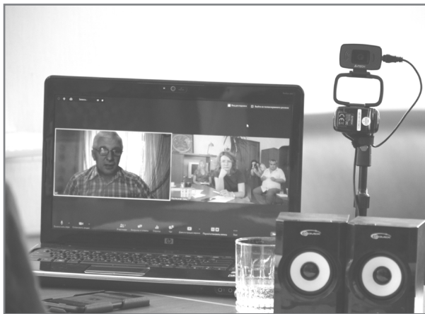
Участь в zoom - конференції

Сьогодні є дуже багато норм законодавства, які змушують владу висвітлювати результати своєї діяльності,