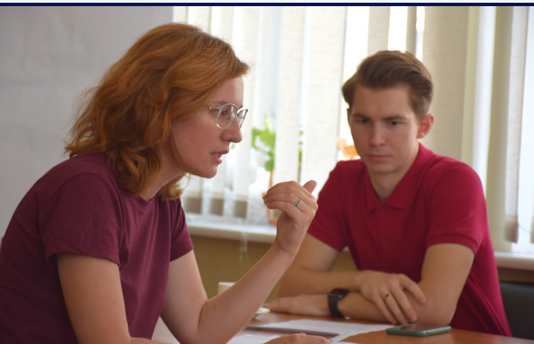
Фото-дайджест "Перехід до цифрового мислення"

©Інститут соціокультурного менеджменту 25000, офіс №1 (2 поверх), вул. Олега Ольжича, 75-а, м. Кропивницький, Україна