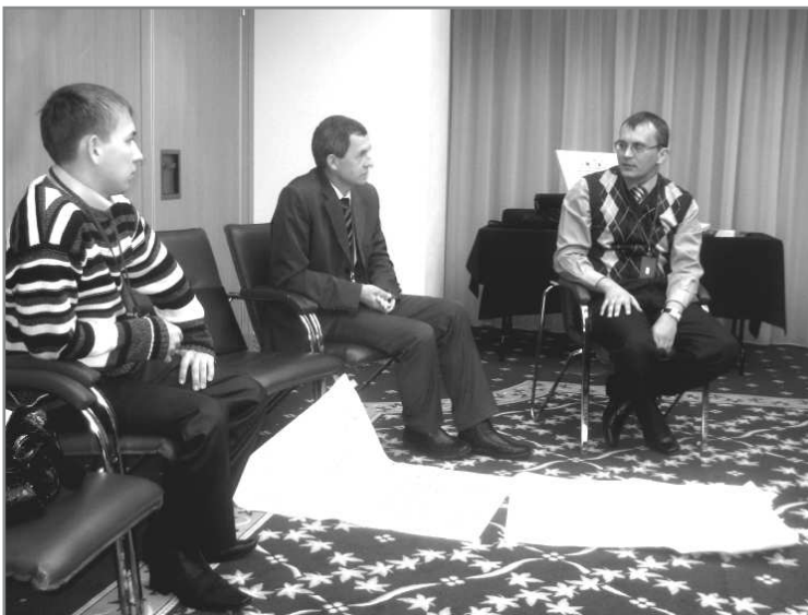
Було використано всі ресурси!

побачимо, що протягом останніх 20-и років вони знаходяться в стані кризи. В чому прояв