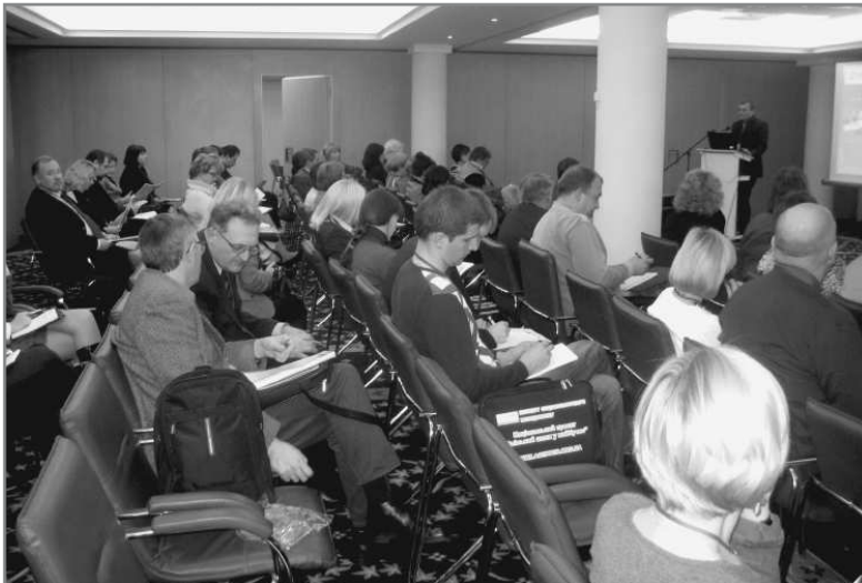
Учасники не лише слухали, а й активно конспектували

підписали меморандум про те, що Донецька влада буде дофінансовувати проекти, які подаватимуться до АГП, спрямовані на трансформування закладів культури в осередки громадської активності і це дофінансування складе близько 2-х мільйонів гривень. Продовжуються переговори з іншими регіональними владами. Зараз тривають переговори з підписання такого ж меморандуму із Міністерством культури. Крім