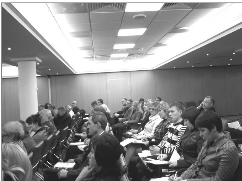
Перше пленарне засідання