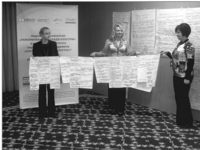
Рекомендації втілені на папері

забирали на себе частину відповідальності, бо якщо людина навіть формально стає членом організації, вона має інше ставлення і бере на себе частину відповідальності. Крім того, загальна стратегічна система управління такими закладами в США включає ще одну структуру. Вона включає ще й благодійний фонд, який є інструментом залучення позабюджетних ресурсів. Ці благодійні фонди