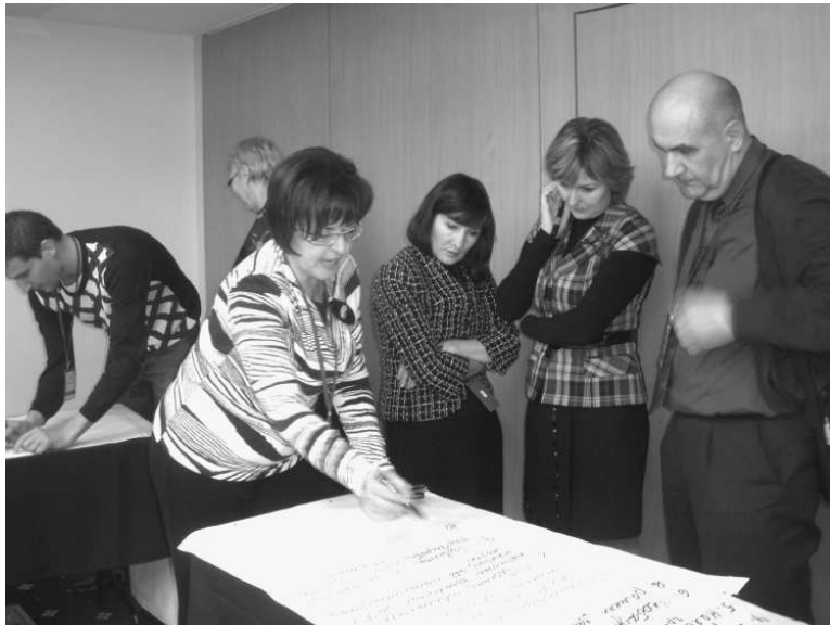
Майбутнє в надійних руках

По суті, вони відрізняються лише функціями, тим, заради чого вони існують, які послуги вони надають своїй громаді. Спілкуючись з багатьма бібліотекарями, в тому числі з нашими стратегічними партнерами, Українською національною бібліотечною асоціацією, ми зрозуміли, що серед бібліотекарів немає розуміння того для