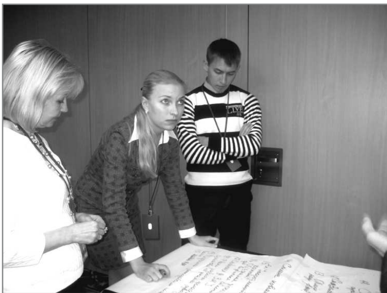
Робота у малих групах

трансформації. Місцеві самоврядування не мають самостійності, не мають ресурсів. Очевидно, що в цій ситуації громадські і благодійні організації не вирішать всіх проблем, але повпливати в якійсь частині громад на вирішення проблем зможуть. Саме тому Антикризова гуманітарна програма