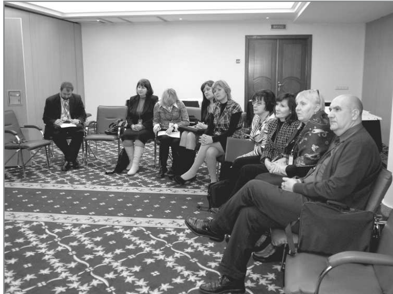
Процес генерації ідей

ширше на діяльність, запроваджувати те, що було колись. Якщо раніше існували політичні лекторії, то зараз в таких політінформаціях немає потреби. Але в правовій освіті, в допомозі людям розібратися як користуватися