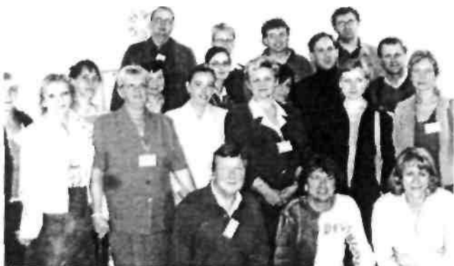
Учасники засідання Європейського представництва IFS. Гданськ, Польща. 2005.

Дякуємо нашим польським партнерам САЛза надану можливість українським ЦАЛ долучитись до світової сім'ї аніматорів. Величезний досвід розбудови громадянського суспільства, напрацьований протягом сторіччя сотнями організацій різних країн, тепер стає доступним для українських аніматорів, які роблять перші кроки на шляху здійснення змін. Ми відчули себе у великій дружній сім'ї однодумців, колег. Ми впевнені, що наша ініціатива щодо впровадження в Україні моделі Центру активності локальної (ЦАЛ) в місцевих осередках культури є вірним кроком на шляху демократичного розвитку нашого суспільства. Будинок культури як ЦАЛ - це неперевершено.