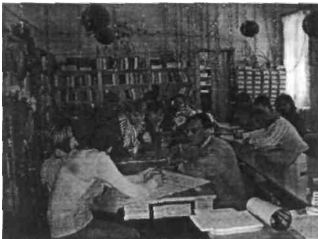
Тренінг в Новгородківському ЦАЛ