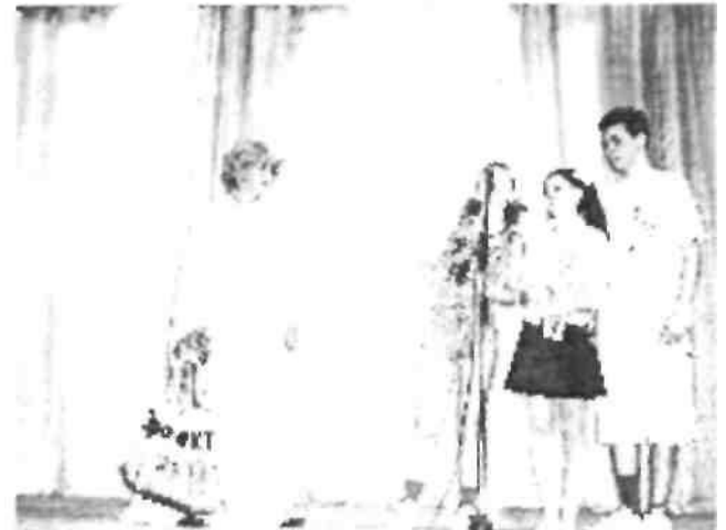
Проект "Повір у себе

інвалідів України " - проект "Соціальна адаптація дітей з обмеженими фізичними можливостями "Повір в себе", який передбачає створення швейного міні-цеху для навчання дітей, соціальну реабілітацію і об'єднання дітей з обмеженими фізичними можливостями в колектив, розвиток професійних здібностей до шиття, виховання почуття корисності суспільству.