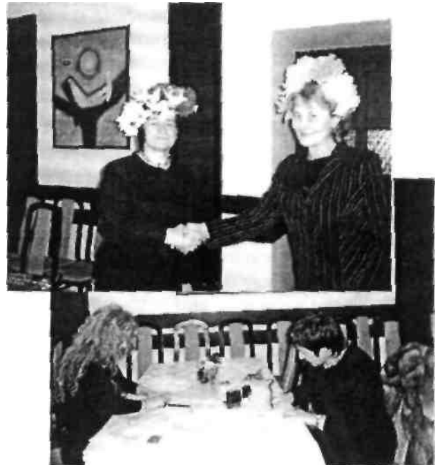
Підписання угод про партнерство.

Разом ми зробили віночки: червоно-білий та жовто-блакитний. Вони стали символом польсько-українського партнерства ЦАЛ. Ми впевнені, що у всіх вистачить енергії для реалізації започаткованих в добрий час ініціатив. Адже ми тепер animatorи.