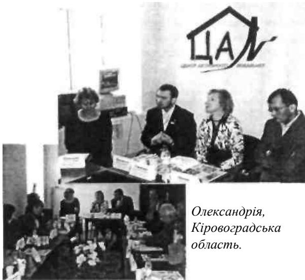
Олександрія, Кіровоградська область.