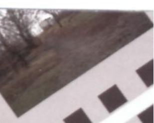
Інформаційна сесія Фонду Євразія. Кіровоград.