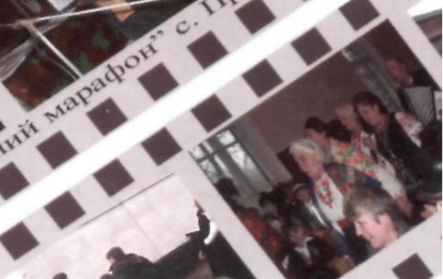
“Благодійний марафон” с. Протопопівка