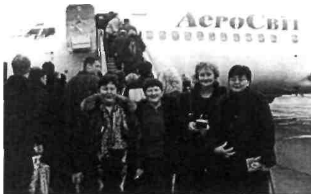
Група українських аніматорів відправляється на стажувальний візит в Польщу

Вищою нагородою для аніматорів польського міста Бжеще є "крила". Саме такий вигляд має головний приз щорічного конкурсу «Аніматор року». Можливо це крила ангела. Можливо могутні крила птаха, які допомагають аніматору буквально літати між безліччю невідкладних справ. Саме такі крила подарував 10 українських аніматорів Міжнародний Фонд "Відродження" для здійснення стажу вального візиту в польських центрах активності локальної (CAL). Групу з десяти аніматорів - експертів з впровадження моделі ЦАЛ в Україні в рамках програми соціальної лабораторії, склали директори обласних та районних бібліотек, будинків культури, громадських центрів, заступник начальника обласного управління культури, завідувача районним методичним центром клубної роботи. Відлучитися на тиждень від справ нелегко. Але крила занесли в місто мрій. Так, тут ми побачили осередки культури, про які мріють тисячі українських громад. І не тільки чудові організації культури, а багато різних